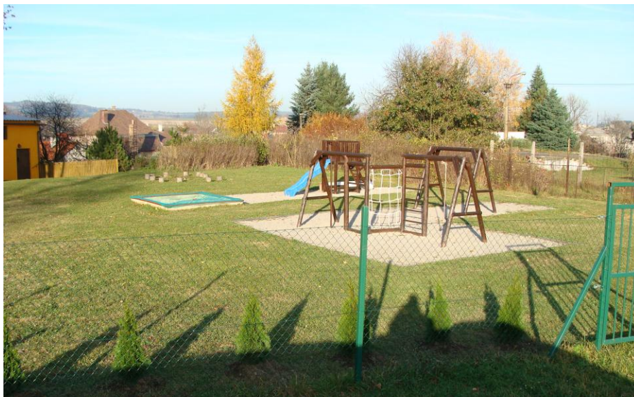
Hřiště mateřské školy