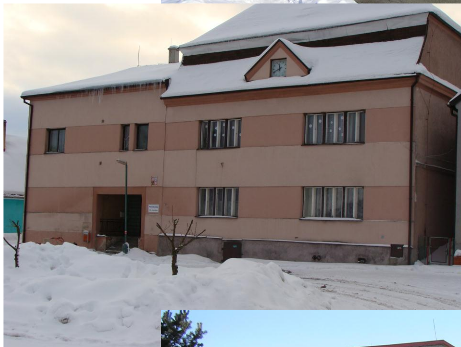
Objekt bývalého obecního úřadu čp. 1