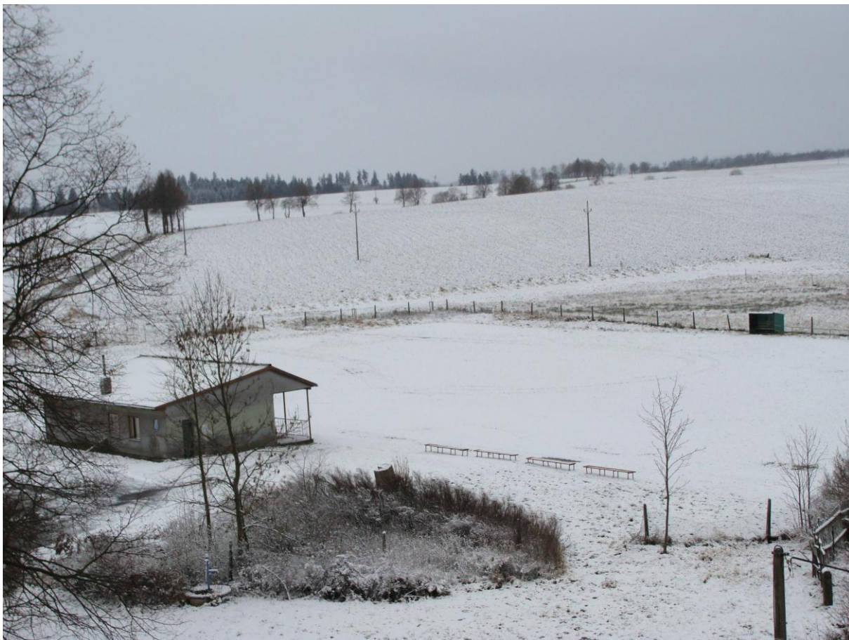
Fotbalový areál a pohled na část obce