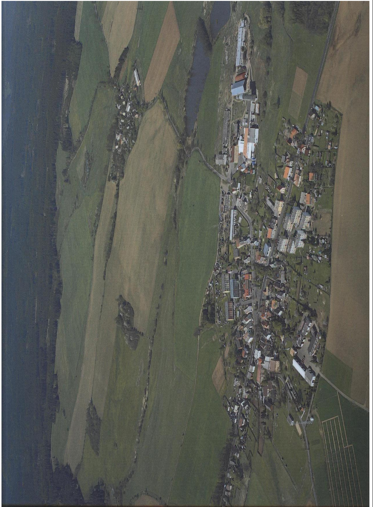
Letecký snímek obcí Krásné Údolí a Odolenovice