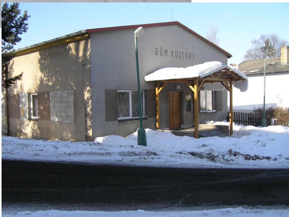
Kulturní dům obce