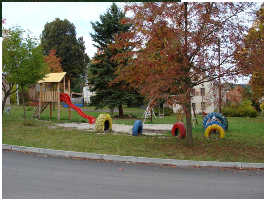
Náves a dětské hřiště v Odolenovicích