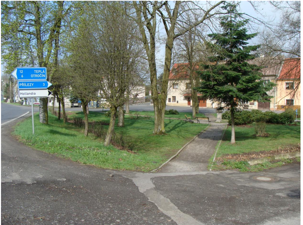
Náves obce Krásné Údolí