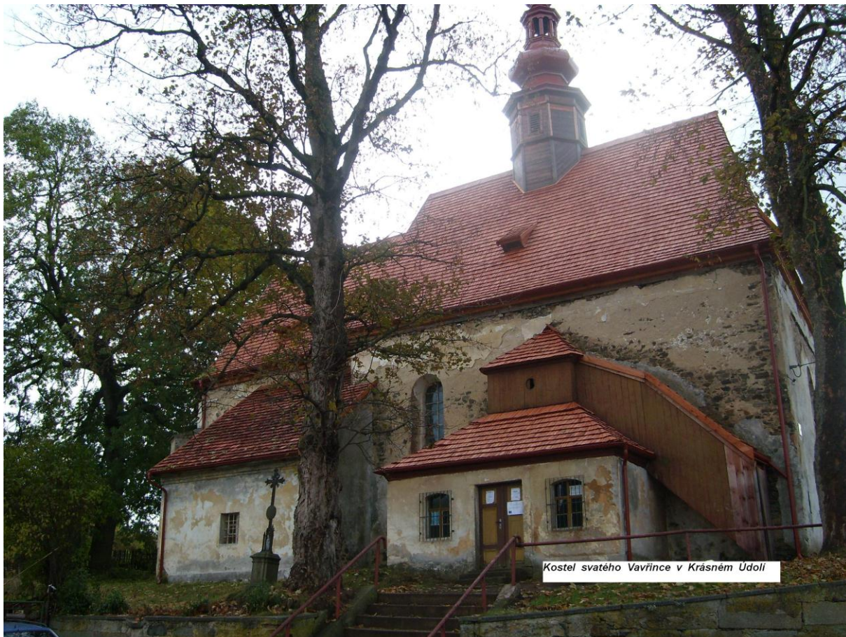
Kostel svatého Vavřince v Krásném Údolí