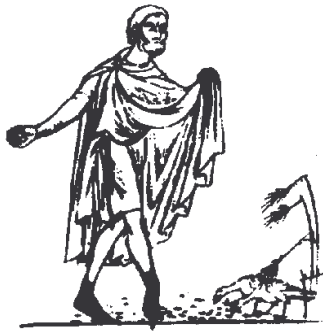
Středověký rolník při setí na dobové miniatuře.

jednoty, Borešem mladším z Rýzmburku (Oseku), Buškem a Bohuslavem ze Švamberku a jejich leníky. Tato událost posloužila jako záminka pro svolání zemské hotovosti, která však byla pod velením nejvyššího purkrabího Oty z Pergova použita panskou jednotou k prvnímu zajetí krále Václava IV.