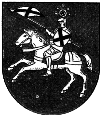
Znak města Krásného Údolí

Jindřich III. z Plavna vymohl u krále Vladislava Jagellonského pro "své věrné" z Krásného Údolí řadu cenných privilegií. Krásnoúdolští měšťané získali stejná městská práva jako bochovští, tzn. právo na týdenní (v sobotu) a výroční trh (jarmark, na den Narození P. Marie), právo hradební (ohradit město hradbami, branami, věžemi a příkopy), právo svobodného stěhování, provozování řemesel a obchodu, právo mílové, právo zřídit si radnici, pivovar, sladovnu, solnici a řeznické lavice. Ku prospěchu místního trhu a k povznesení obchodu bylo kupcům příjízďejícím od Chebu přes Kynžvart a Otročin, nebo přes Loket a Bečov, a také od Útviny na trhy do Krásného Údolí uděleno právo volné cesty, ovšem s výjimkou dní, kdy se konaly trhy ve Žluticích.