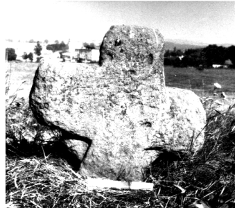
Kamenný (smírčí) kříž