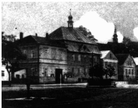
Budova radnice čp. 1 kolem r. 1930.