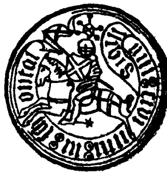
Pečeť města Krásného Údolí užívaná od 15. stol.

(v překladu: "starostenský úřad Krásného Údolí"). Ke zhotovování pečetí se užívalo přírodního černého, zeleného nebo červeného vosku. Červený vosk byl vyhrazen panovníkovi, šlechtě, církvi a privilegovaným městským obcím. Město Krásné Údolí mělo právo užívat na své pečetě zeleného vosku, písemně je toto doloženo až v urbáři toužimského panství z r. 1638.