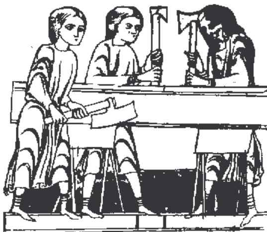
Středověcí tesaři při práci na dobové miniatuře

Město mělo také právo hrdelního soudu, tedy právo odsuzovat těžké zločince k trestu smrti. Existenci popraviště a hrdelního soudu dokládají nejen stará místní jména "Šibeniční pěšina" (něm. Galgensteigl) či pole zv. Soudný (něm. Gerichtssacker) jižně od obce při pěšině do Sedla, ale také záznamy v městských účtech z poč. 17. stol. s poplatky za kata z Jáchymova, jemuž se platilo 11-15 zl, či výdaje pro městského písaře či soudní sluhy. Jinou připomínkou středověkého soudnictví, instituce smířčího práva, by mohl být kamenný kříž na západním okraji obce zvaný "Švédský". K této památce se váže několik pověstí. Podle jedné tu měl být během třicetileté války zabit jistý šlechtic z Buče (von Buscha) se svými dvěma dcerami. Nejspíše by se mohlo jednat o jistého urozeného pána z Mangoldu , který zde byl skutečně usazen na svobodném statku (nyní usedlosti čp. 26). Při útěku tu byl se svou rodinou dostižen a v boji zabit. Zachránila se pouze jeho manželka, která se ukryla v blízkém lese, neboť po válce se v matrice objevuje již jen urozená paní z Mangoldu , která ale Krásné Údolí brzy opustila. Tohoto šlechtice připomíná i staré jméno usedlosti Buscha-Ontla (později Markleina). Jiná pověst hovoří o tom, že zde v době třicetileté války žil početný rod Leinerů . Jednou za války, když se chtěli členové sedmi rodin rodu ukrýt v lese před švédským vojskem, byli v místě kříže dostiženi a pobiti až na jednu rodinu, které se podařilo uprchnout do lesa. Tato